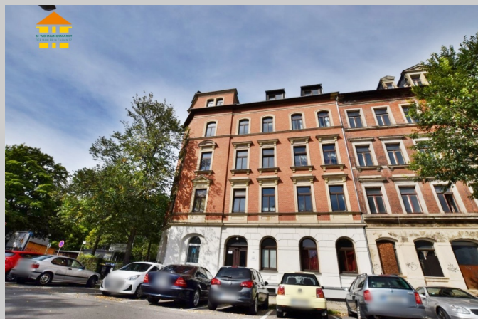
Matthesstraße 80 in 09113 Chemnitz