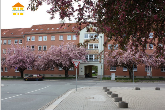
Lutherstraße 26 in 09126 Chemnitz