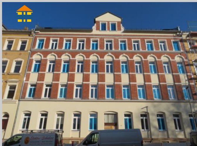
Jakobstraße 45 in 09130 Chemnitz