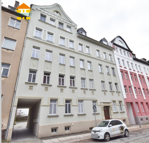
Casparistraße 6 in 09126 Chemnitz