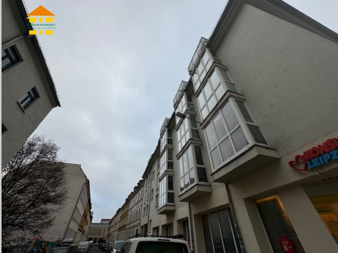
Demmeringstraße 9 in 04177 Leipzig