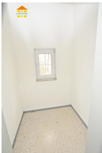
Abstellraum auf halber Treppe