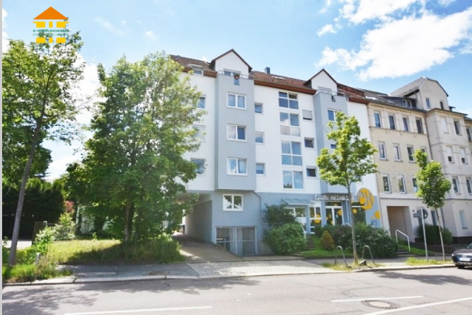
Heinrich-Schütz-Straße 90 in 09130 Chemnitz