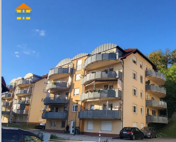
Wiesengasse 11 in 03130 Spremberg