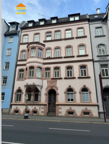
Trockentalstraße 91 in 08527 Plauen