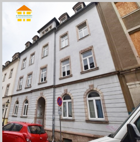
Zöllnerstraße 10 in 09111 Chemnitz