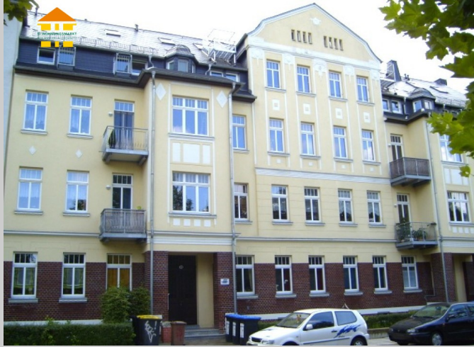
Bodelschwinghstraße 19 in 09116 Chemnitz