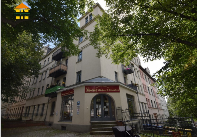
Gneisenaustraße 10 in 09131 Chemnitz