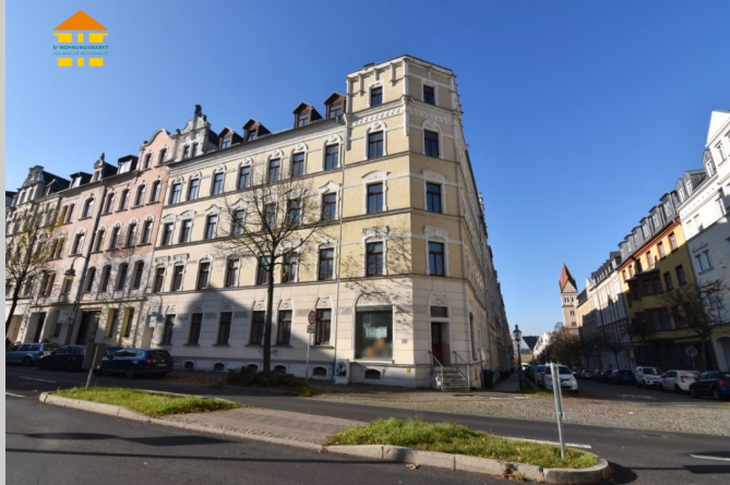
Ludwig-Kirsch-Straße 32 in 09130 Chemnitz