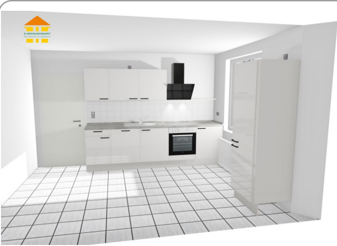
Illustration der möglichen EBK