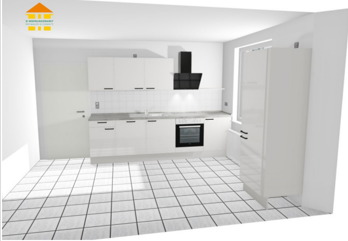
Illustration der möglichen EBK