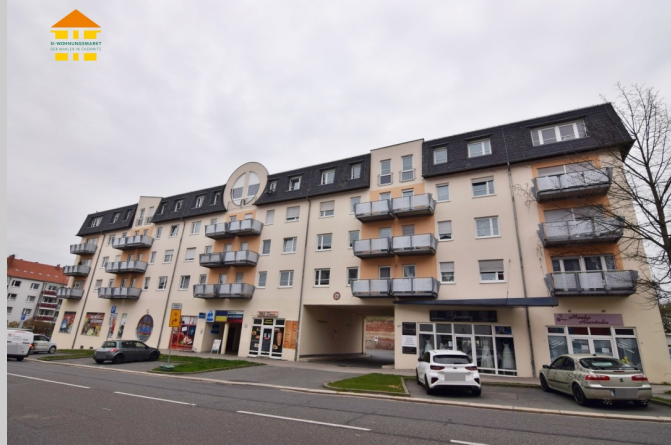
Clausstraße 47 in 09126 Chemnitz