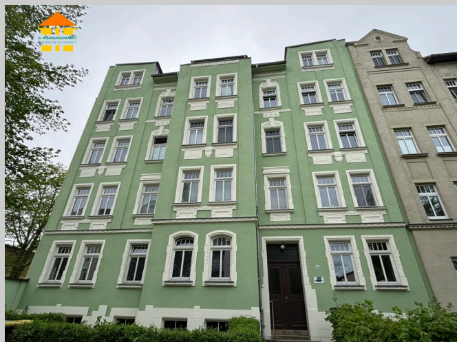
Horst-Menzel-Straße 10 in 09112 Chemnitz