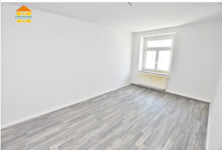
Wohn- und Schlafzimmer