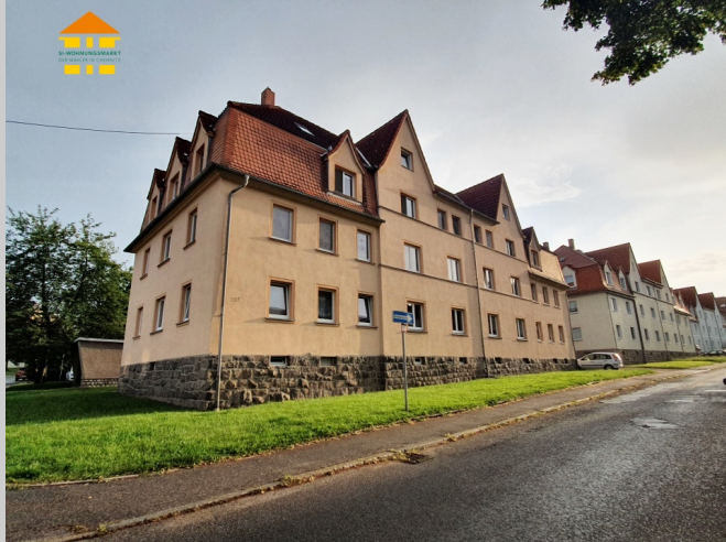
Pestalozzistraße 15 in 08062 Zwickau