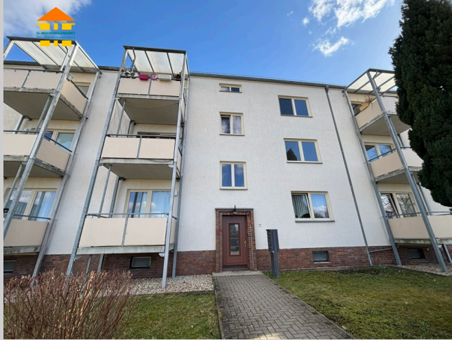
Sachsenring 23 in 09127 Chemnitz