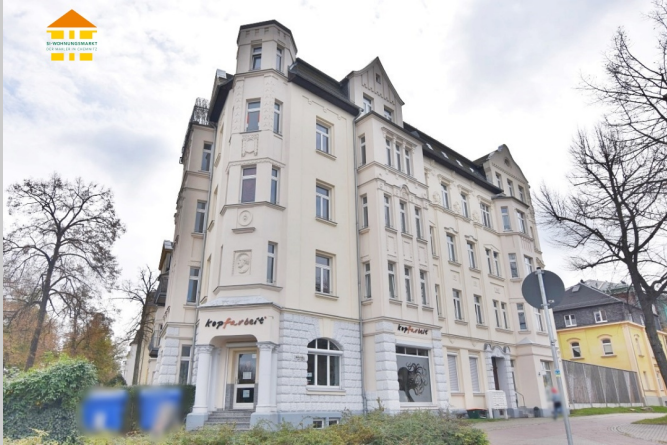
Neefestraße 89 in 09119 Chemnitz