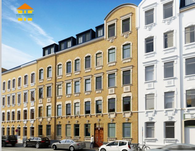
Sonnenstraße 71 in 09130 Chemnitz