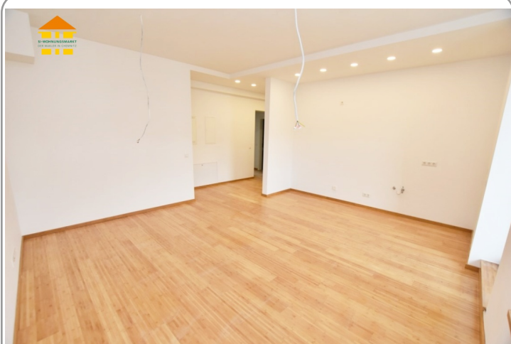
Wohnzimmer mit offener Küche