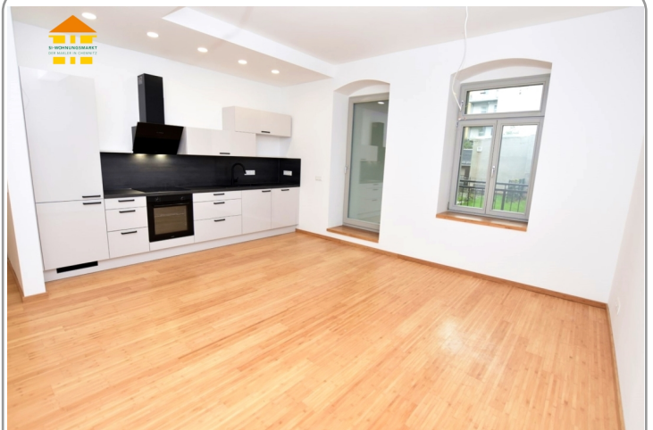
Einbauküche - Vergleichsbild