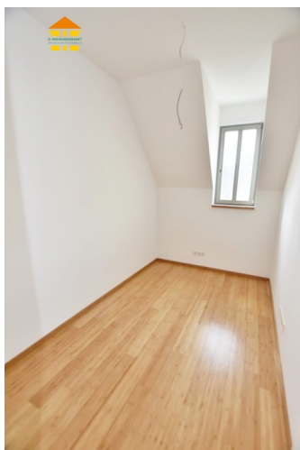
Kinder- oder Arbeitszimmer