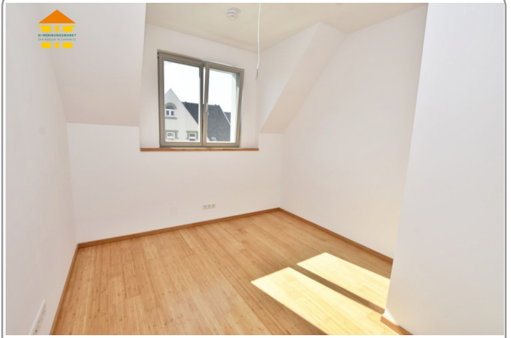
Kinder- oder Arbeitszimmer