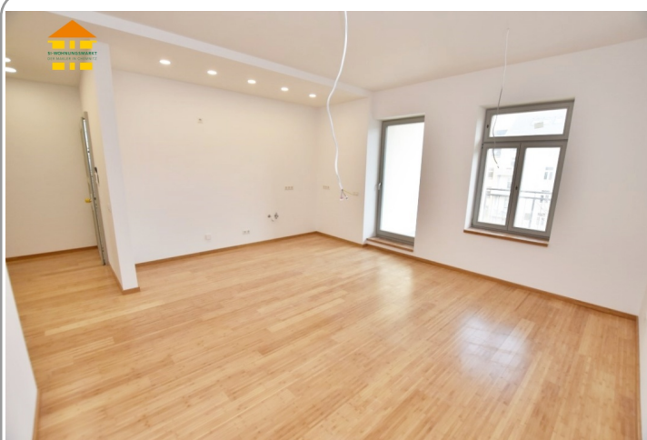
Wohnzimmer mit offener Küche