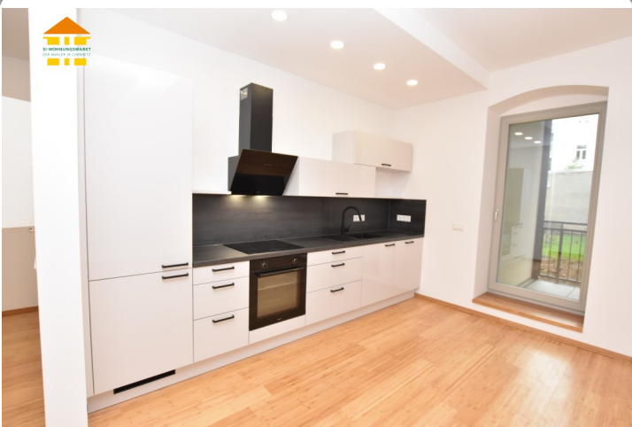
Einbauküche - Vergleichsbild