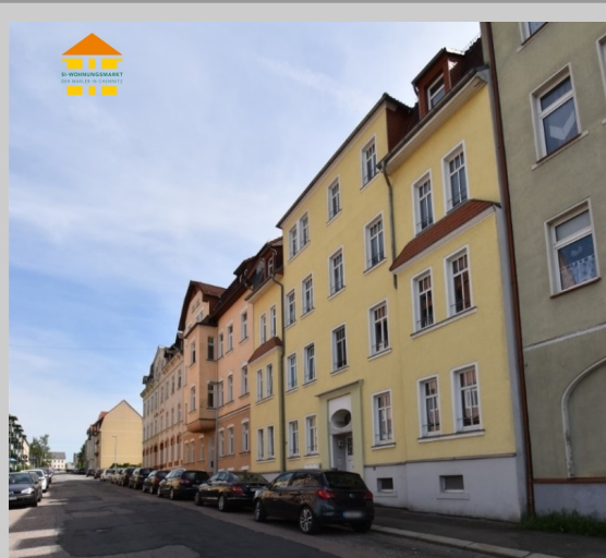
Hohe Straße 38 in 09669 Frankenberg