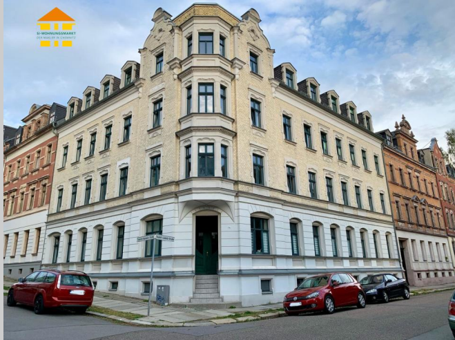
Friedrich-Naumann-Straße 2a in 09131 Chemnitz