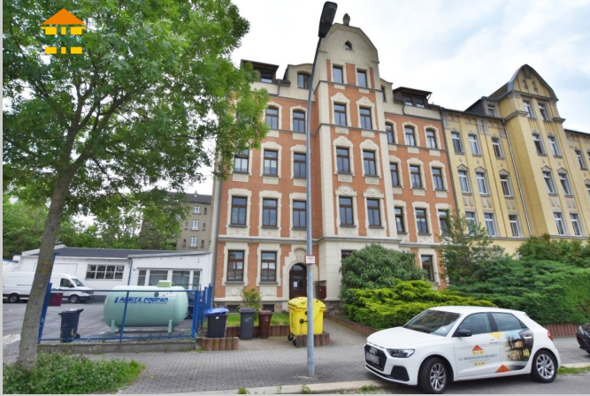
Elsasser Straße 15 in 09120 Chemnitz