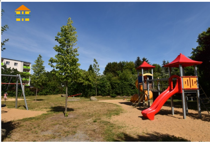
Spielplatz / Umgebung