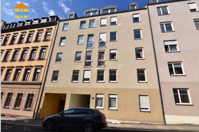
Gießstraße 25 in 09130 Chemnitz