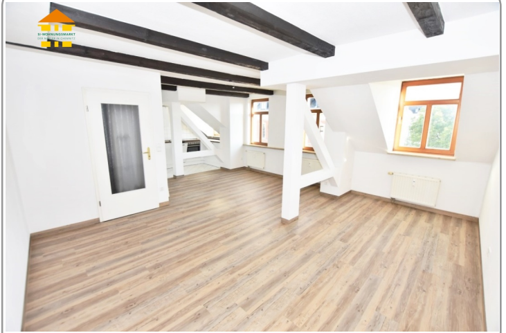
Wohn- und Schlafbereich