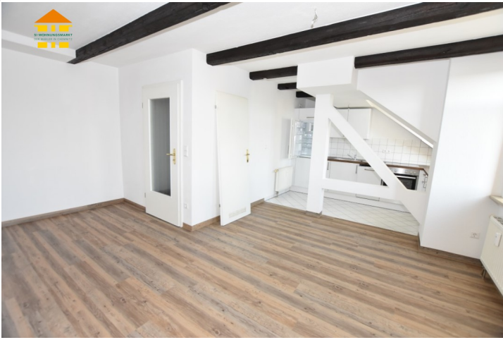
Wohn- und Schlafbereich