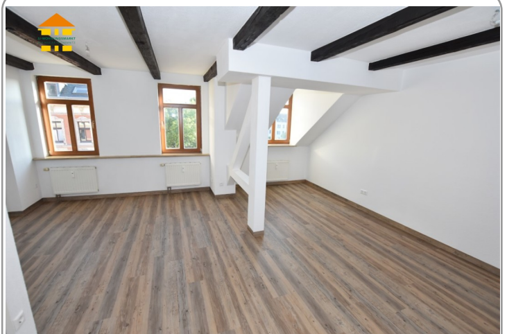
Wohn- und Schlafbereich